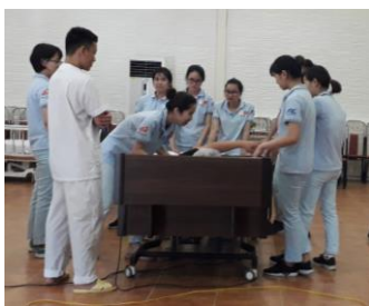
施設で介助の練習中です。

排泄介助の時とおむつ交換の時、尿の色と量を観察して、メモしなければなりません。入浴介助するとき、水の温度を確認すること、利用者さんが転倒しないようによく注意することが大切です。施設の利用者さんは家族の