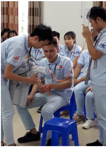
看護の専門講義では、候補者たちが点滴のしかたも学びました。

「とてもためになりましたが、専門用語がとても難しく、覚えるのが大変でした。また、日本には病